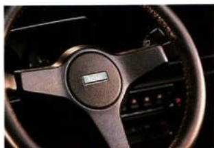
Sieht gut aus, liegt perfekt in der Hand: griffiges Lederlenkrad mit exklusivem Mini-Emblem.

It's great, Britain! Ausdrucksstärker als im Mini Balmoral lassen sich Eleganz und selbstbewußtes Understatement eigentlich nicht verbinden. Für Menschen, die die Kunst beherrschen, Stil und unbeschwerter Lebensfreude gleichermaßen zu dokumentieren.